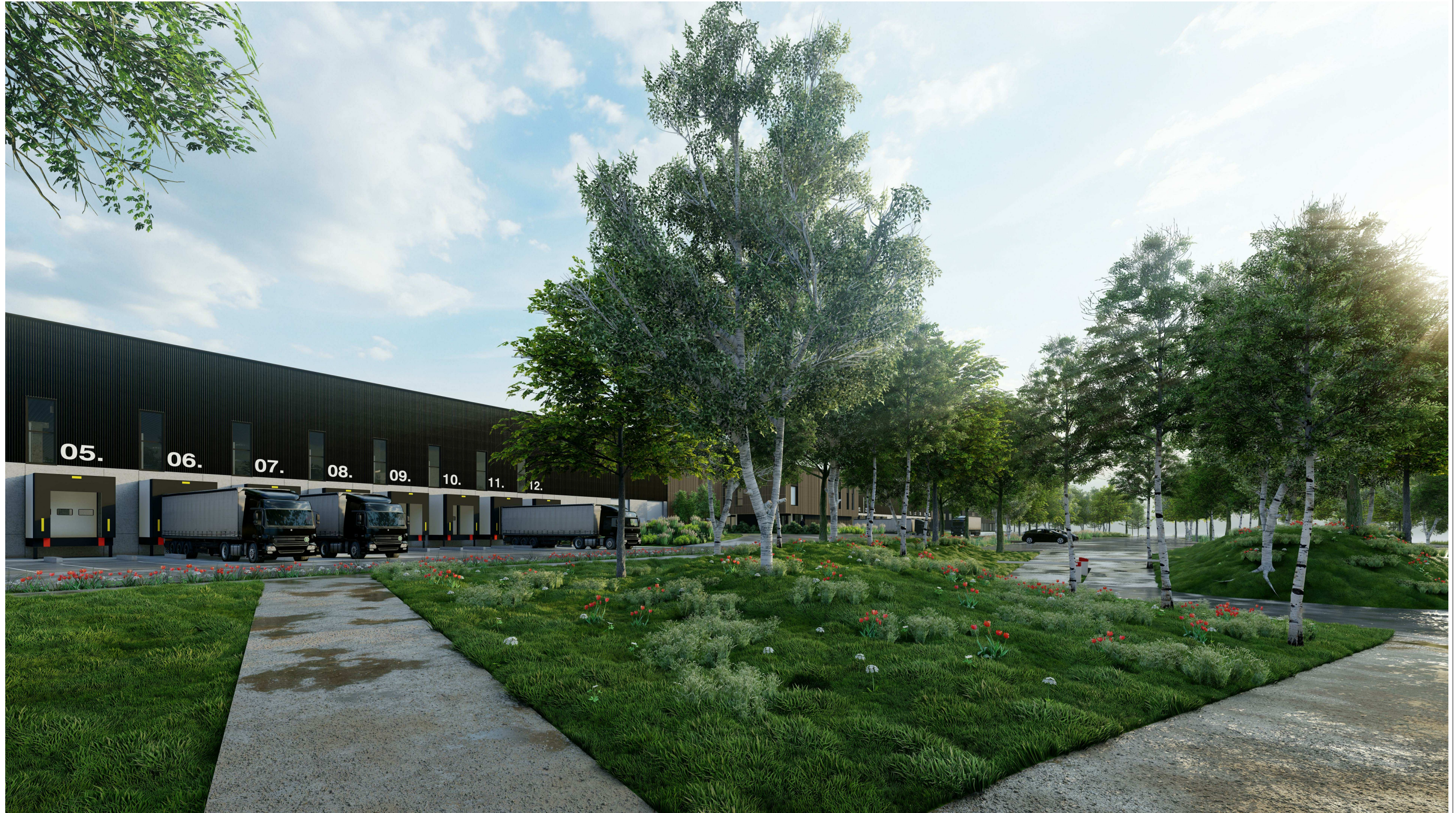
Perspective depuis l'entrée piétonne