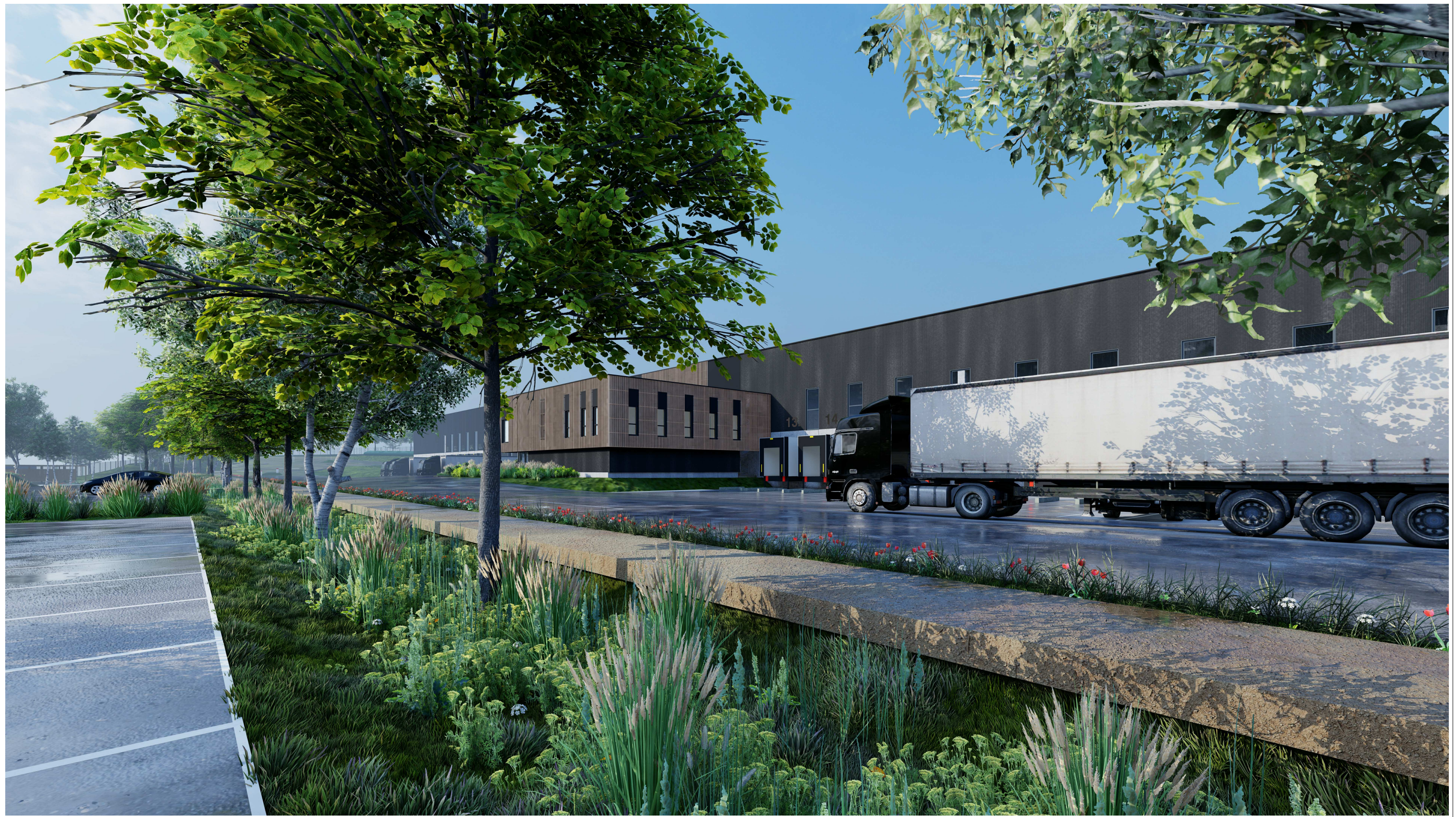
Perspective sur les bureaux