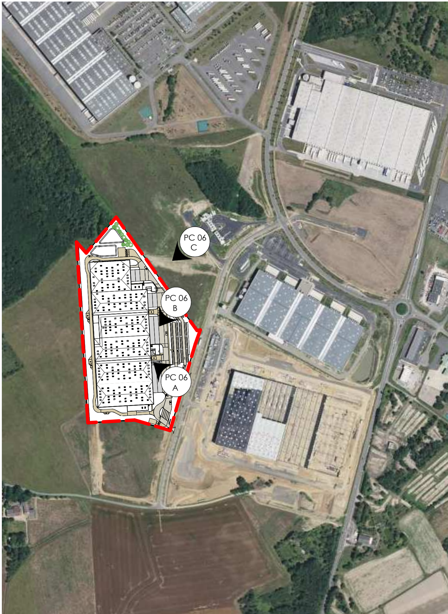
Repérage des perspectives